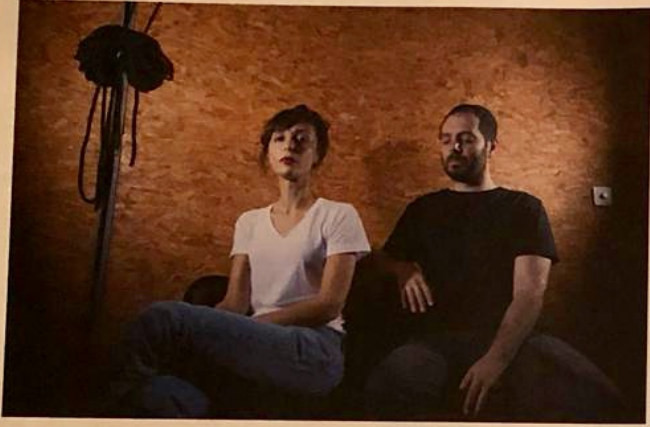
KONTRAST / İZLAYAN / #606060