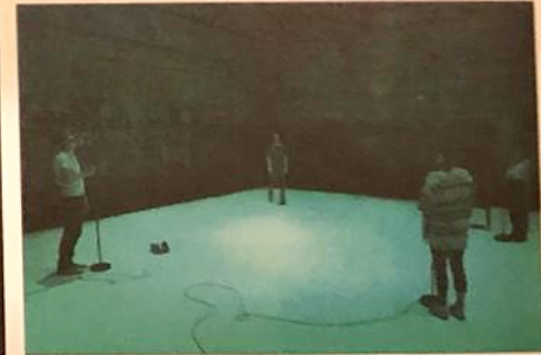
The West Is The Best

Ballroom Night'a hazırlanmak için biriken'in tavsiyeleri nedir? Geceye katılan herkesin davetli sanatçılar kadar kendilerini bagrıde hissetmelerini arzu ediyoruz. Geceye hazırlanmak için klasik balo kategorilerinin ötesinde kendinizi içinde "göç" hissettiğiniz kostimlerle bize katılmayı tavsiye edebiliriz. Ög dünyadaki yapıtıcı yağam koşullarından kaçış bir eğlence ve gerçek bir beraberlik ruhıyla hep beraber soyulanabileceğimiz, birbirimize ilham vereceğimiz, yüksek enerjili bir geceye hazır olun.